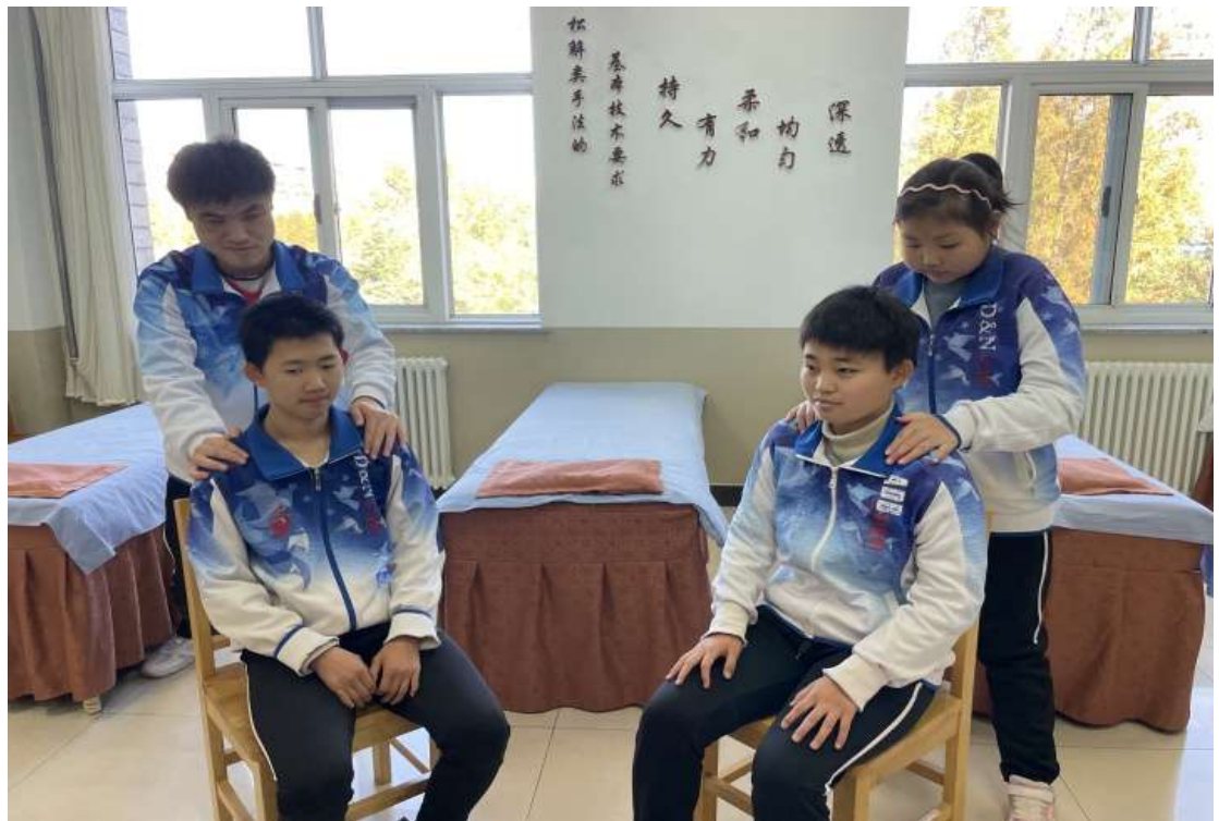
图 10 中医养生保健专业学生小组合作学习

在探索和实施小组合作、自主探究学习，推行分类分层次教学的基础上，形成了以项目教学、案例教学等为主体的教学模式。为了加强专业与岗位的对接程度，学校选拔专业骨干教师与医院和按摩诊所的按摩专家共同研究专业建设和课程改革，逐步将传统的学术导向学科课程体系，转变为以岗位能力为核心的工作导向课程体系，增强视障学生岗位适应能力。