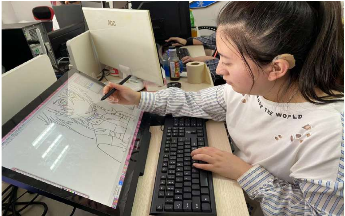
图 16 学生在大连喜爱动漫科技有限公司实习