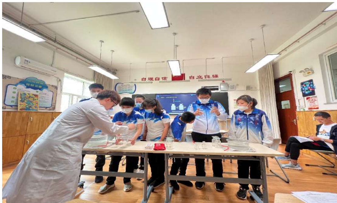
图 13 校级优质课评选活动

本年度举办了教学基本功竞赛、职业技能大赛，开展职业体验周活动，展示各专业在教学工作过程管理、执行教学规范、坚持内涵发展等方面所取得的成绩，加强自我诊断，提高自主发展的能力，加强交流学习，通过活动，强化专业建设，深化教学改革，提升管理水平，提高教育质量。每学期开展组内、校级教研课活动，在活动中展示和提升教师教育教学理念和实践操作能力。