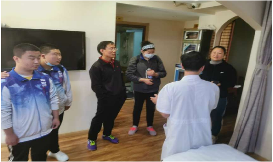
图 21 按摩专业学生在企业实习