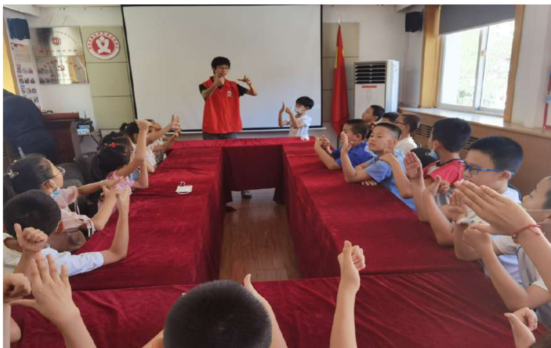
图 19 教师进社区开展为民服务

学校始终将为社会服务视为工作职责，近年来，学校经常利用寒暑假、双休日开展技术服务进社区工作，将相关专业知识、技能、服务送到社区，党员、志愿者定期利用所学知识、技能开展为民服务。2022年，为社区居民进行医学普讲座80人次。