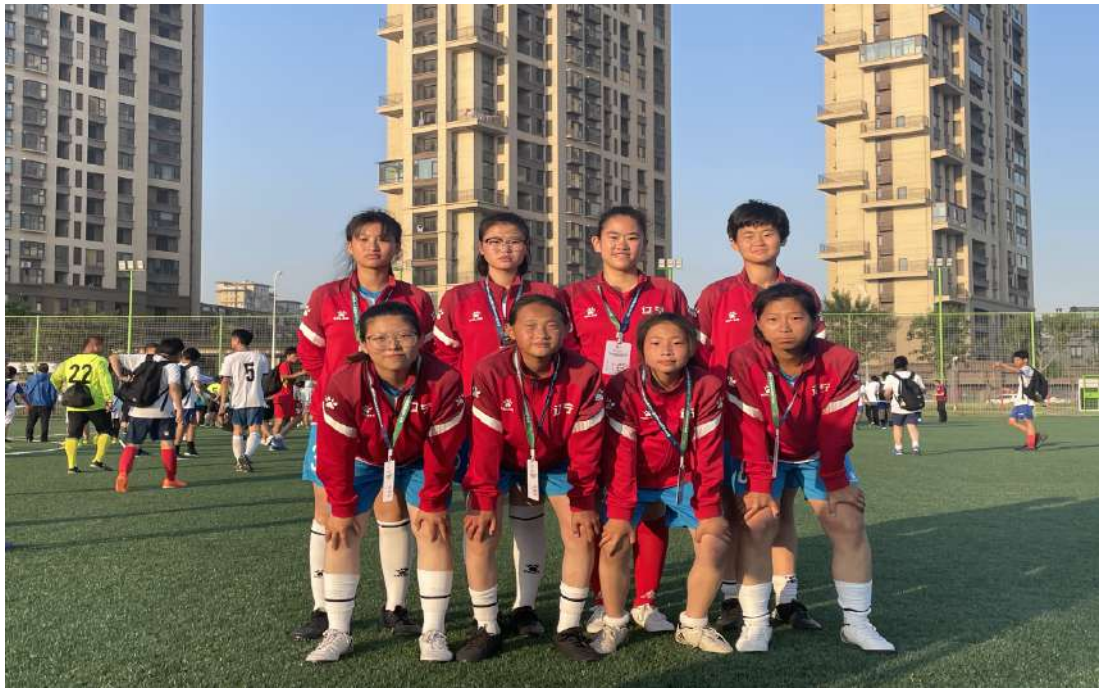
图 2 校女子组球队代表辽宁省参加第八届特殊奥林匹克运动会五人制聋人足球比赛

盲聋职业高中均是 3 年制的，目前开设了艺术设计制作、中西面点制作、中医康复保健 3 个专业，在校生 72 人，2022 年总共招生 19 人。职业高中的学生，在学校正确的引导教育下，思想积极向上，精神状态饱满，能够积极参与课堂教学，学习态度端正，由于学习能力的差异，每一个学生对自身职业生涯的规划也有区别。但学生们能客观地认识和评价自我，对职业的理解也越发理性。学生们认同学校的教育，同时也非常认同社会、企业为其提供的各方面的培训和教育，信任学校为其提供的学习和未来的安排，并对自己和学校的发展充满信心。学生们期望通过自身的努力，将来更