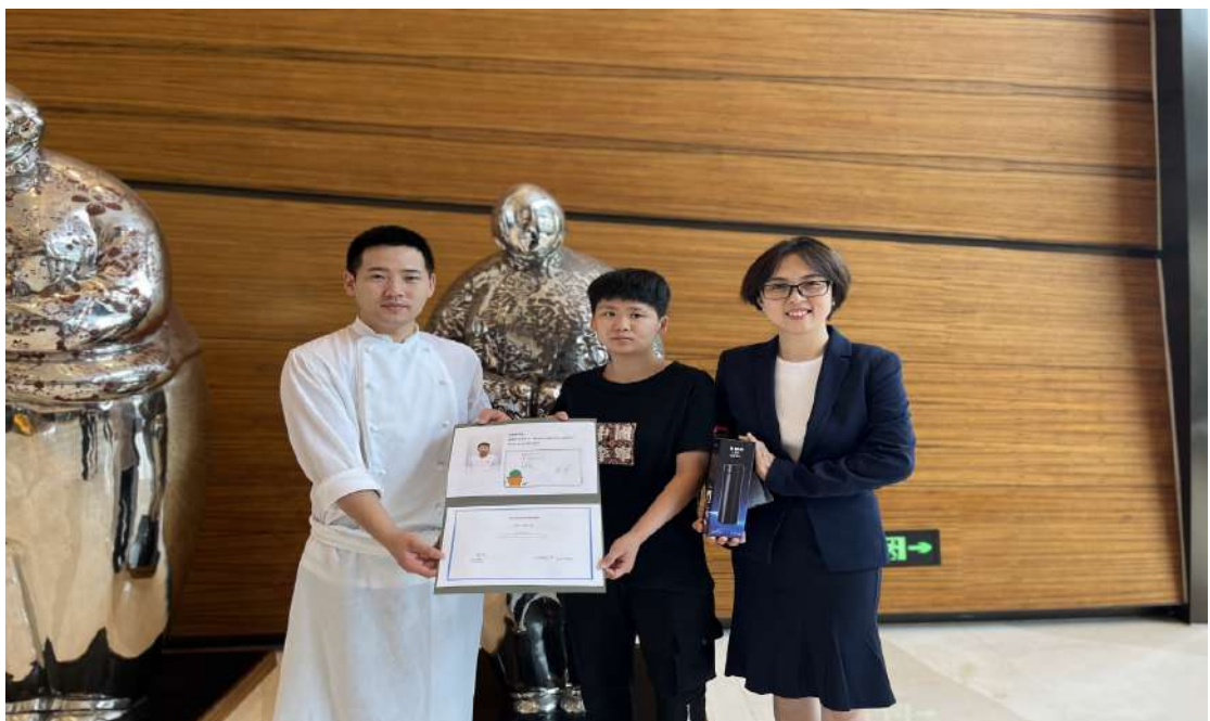
图 15 学生在大连希尔顿酒店实习