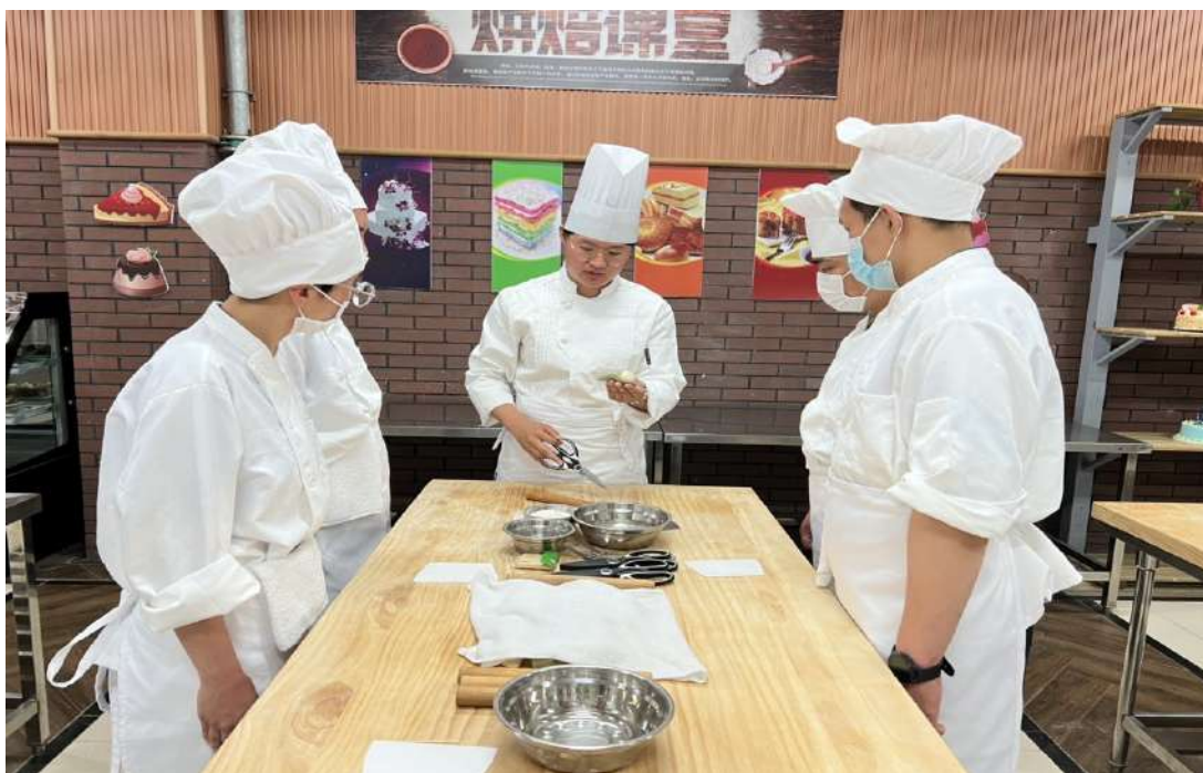
图9 中西面点专业在实训基地上课

论+实践”的教学模式，采用“理实一体化”教学模式。推行“理实一体化”教学，让学生“在学中做、做中学”，解决了理实“两张皮”的现象，极大地调动了学生的学习积极性。2022年，继续发挥校企联盟在评价方面的作用，持续推进教学模式和评价模式改革，实施“理实一体化”等教学模式和教师、学生、企业、社会“四方参与”的多元评价模式，教学改革取得了明显成效，人才培养质量明显提高，有效解决了特殊学生社会融合的问题，有效提升了课堂教学效果和办学质量。