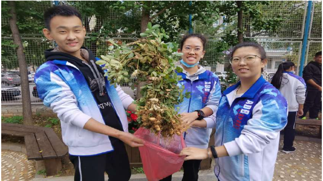
图 6 融合种植园喜获丰收

加强行为规范养成教育，开展诚信从身边做起活动。对学生的学习习惯、遵章守纪习惯、文明礼仪习惯、劳动卫生习惯进行训练和教育，并强化行为规范教育的量化措施。