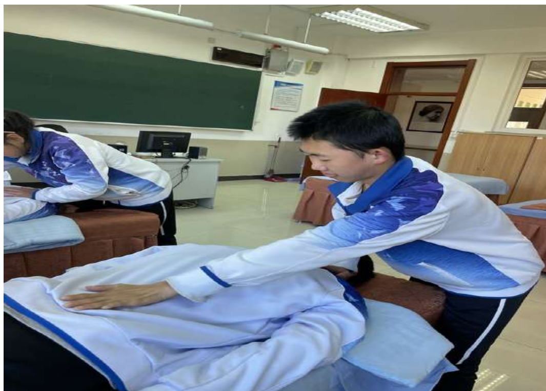
图 11 中医养生保健专业学生在手法练习室实践

专业均实现了教学、实训一体化，学生职业道德、职业精神培养与技术技能训练高度融合。实训室使用率高，开课率达100%。