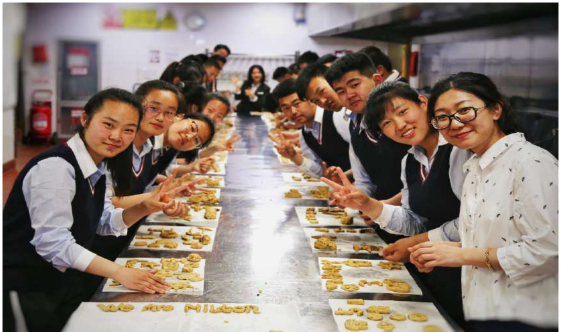
图 3 学生参加中式面点职业体验活动

好地为社会和企业服务，为母校争光，成为学弟学妹的榜样。 谈及未来，每一名学生都充满了对未来的向往。