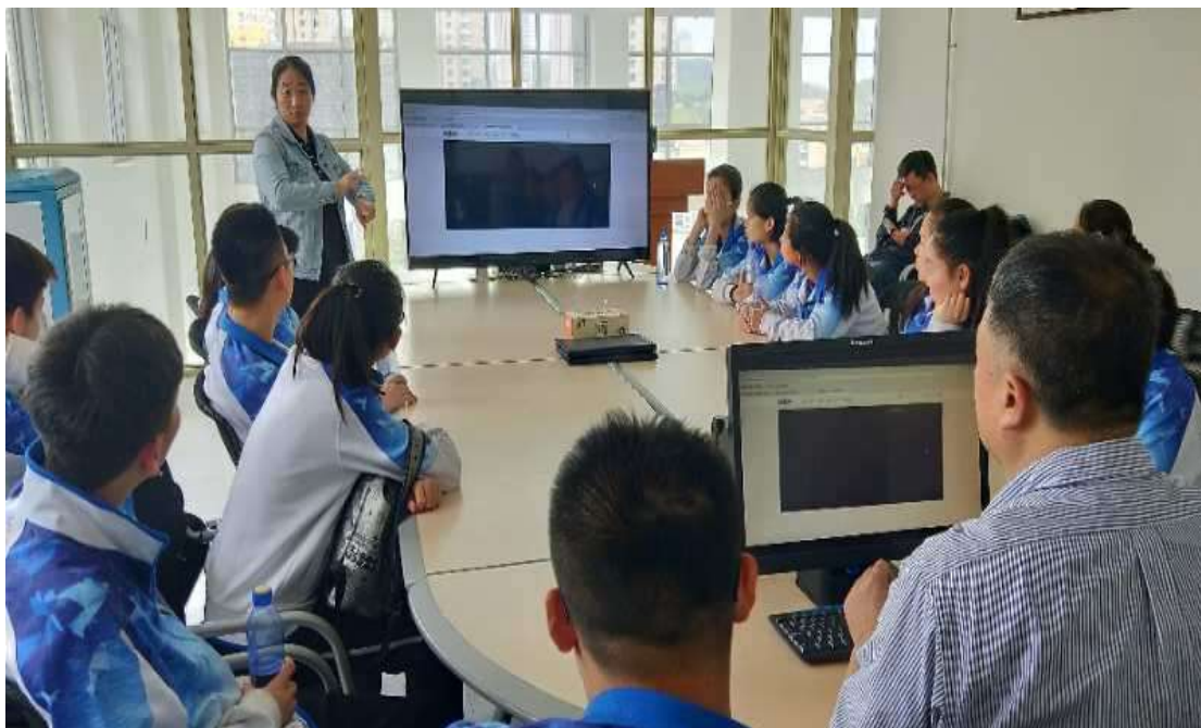
图 8 学生进行艺术设计与制作专业的职业体验活动

理调配工学时间，共同安排授课教师和指导师傅、共同确定教学计划和培训内容，开展校企融合教学，学生毕业即就业，顺利步入职场。