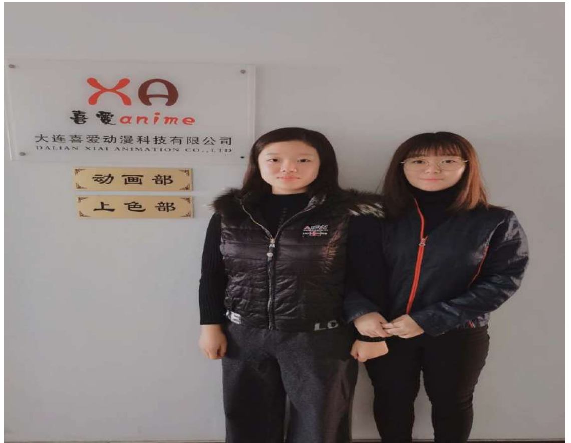
图 14 学生就业于喜爱动漫有限公司