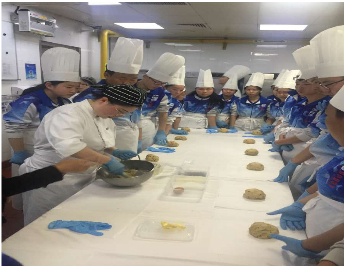
图 12 中西式面点专业学生在烹饪职高上课