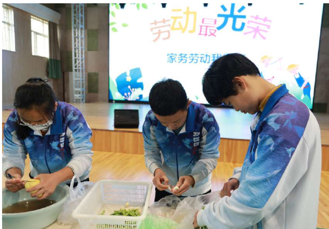
图 5 学生家务劳动比赛现场

为了落实“五育并举”，“劳动为本”的思想，培养学生养成崇尚劳动、尊重劳动、热爱劳动的良好习惯，在全校范围内营造劳动最光荣、劳动最崇高、劳动最伟大、劳动最美丽的良好氛围，让学生从小养成爱劳动的好习惯，学校积极开展系列沉浸式劳动教育实践活动。一系列沉浸式劳动教育实践活动，把热爱劳动、崇尚劳动的理念融入到了学生的日常学习和生活中，把劳动作为一项能锻造人格品质、实现生命成长的重要教育手段贯穿学校教育始终。