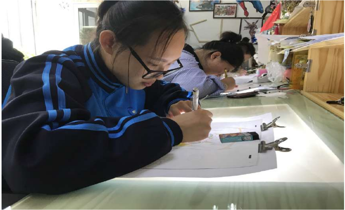
图 17 学生在大连喜爱动漫科技有限公司实习