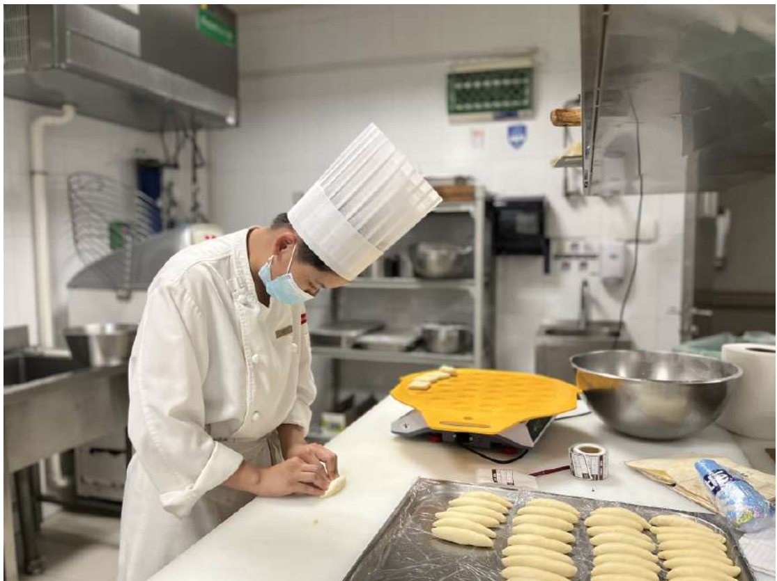
图 22 面点专业学生在企业实践