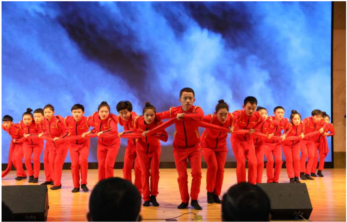
图 1 校舞蹈团表演舞蹈《我心向党》

学宗旨到办学理念，从教育理念到培养目标，从校训、校风到校魂，校园文化努力营造全方位的育人机制，以“春风化雨，润物无声”的方式进一步丰富文化的育人功能，使每一个学生都精彩绽放，幸福成长。