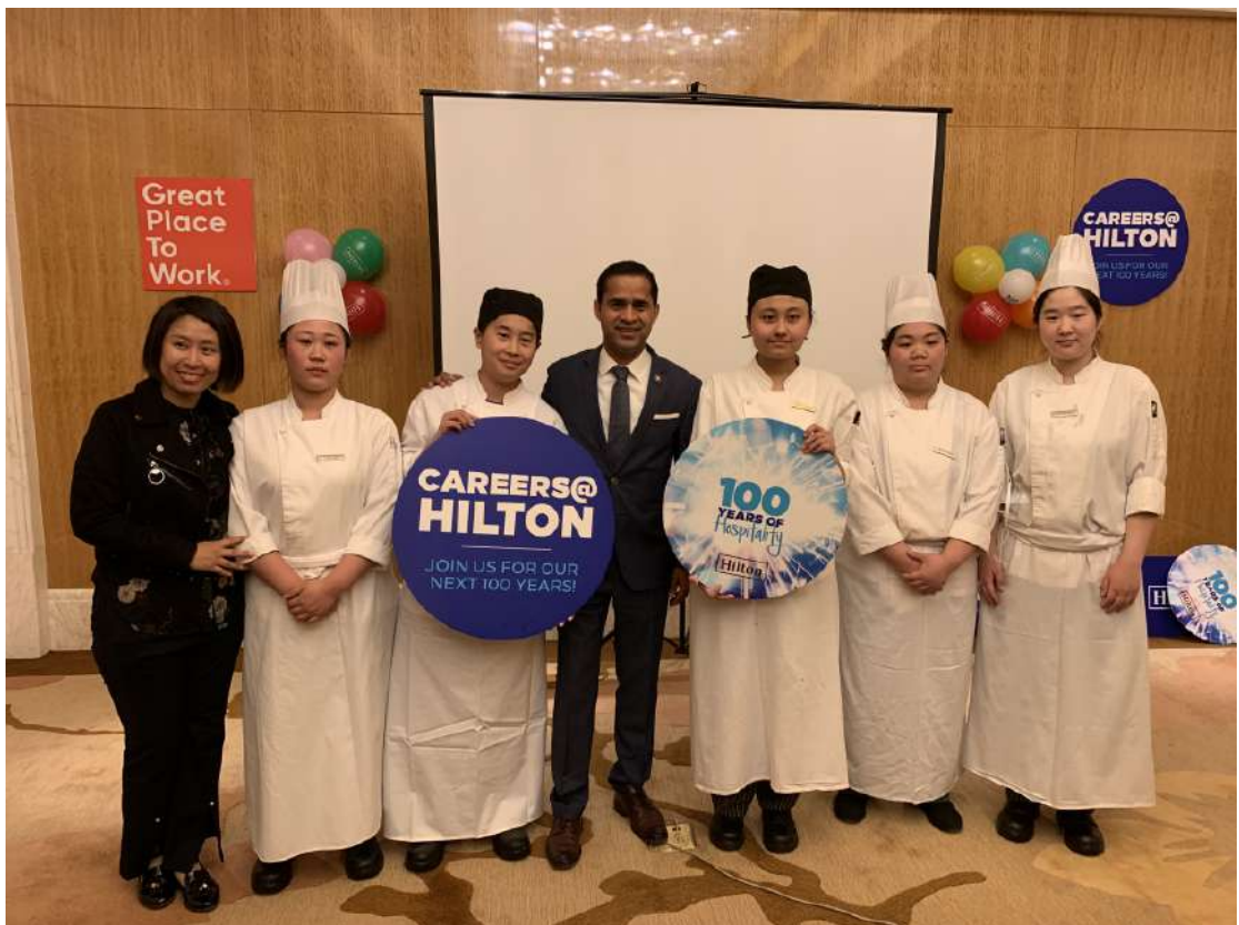
图 18 学生在大连希尔顿酒店实习